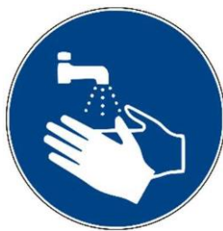
Hugasan ang mga kamay