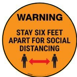
Panatilihin ang distansya