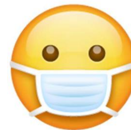
Magsuot ng mask