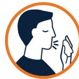
Takpan ang bunganga kung ubo