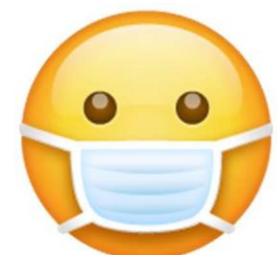
Agusar iti mask