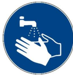
Ugasan dagiti ima