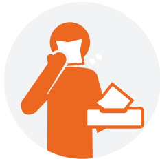
Ho và hắt hơi