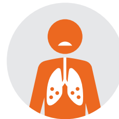
Ốm nặng (ốm)