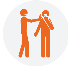
Contacto estrecho con personas, como tocar o dar la mano