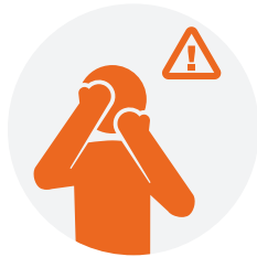
Tocar un objeto o superficie que tiene el virus, y después tocarse la boca, nariz u ojos.