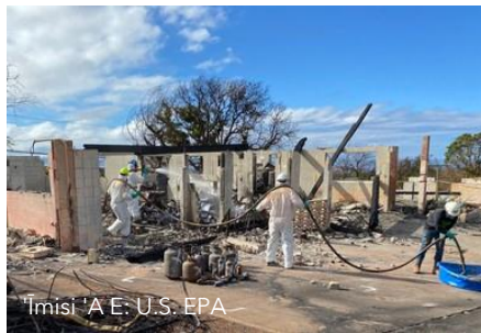
Timisi 'A E: U.S. EPA