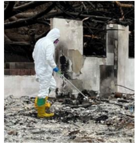
'Oku tānaki 'e he kaungāue DOH 'a e 'ū semipolo 'o e efuefu 'i Kulá

Ko e efuefú ne tānaki mei Sepitema 21 mei he 'ū 'api 'e valu ne vela 'i Kulá, 'a ia ne langa 'i he 1930 ki he 2000. Koe'uhi ko e 'ū 'api 'i he 'ū 'ēlia ne uesia 'i Lāhainā ne langa lolotonga 'o e taimi tatau, 'oku fakafuofua 'a e Hawai'i Department of Health (Potungāue Mo'ui 'o Hawaii, DOH) 'e tūkunga tatau 'a e efuefu 'i Lāhainā.