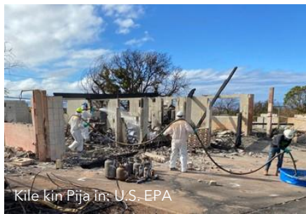
Kile kin Pija In: U.S. EPA