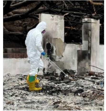
Rijerbal ro an DOH rej aen jaambol in melkwarkwar ko ilo Kula

Emōj kar aen jaambol in melkwarkwar ko ilo Jeptomba 21 jen ruwalitok em ko rekkaer bwil ilo Kula, im rekkaer ekāl ilo 1930 lok ñan 2000 iio ko. Kinke em ko rekkaer jorrāñ ilo Lāhainā rekkaer ekāl ilo ejjā iio kein Hawai'i Ra in Eymour (DOH) ej kātmane an melkwarkwar eo ilo Lāhainā naj bar wōr joñan baijin in ae.