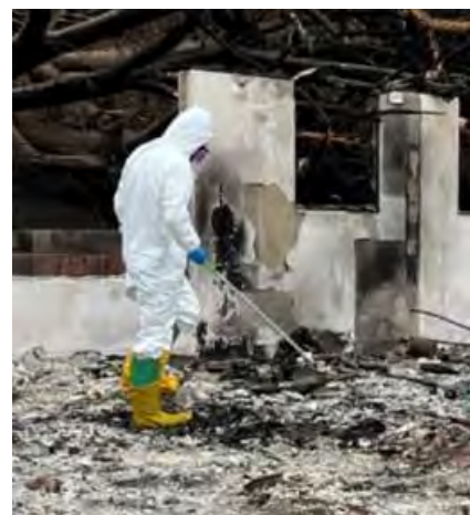
Chon angange DOH ra ioni asosotun kena non Kula

Ekkewe asosotun peas ra kan ionir won September 21 seni wanu imw kena ra kareno non Kula, ina ra kan fen kawuuta seni ekkewe ierin 1930s tori ekkewe 2000s. Pokiten ekkewe imw non ewe neni a kan tano seni Lāhainā ra kan kawuuta nupwen ewe chok attun fansoun, ewe Hawai'i Department of Health (DOH) a kan ekkieki pwe ewe peas non Lāhainā epwene angei ew wewefengenin porausen monungawen.